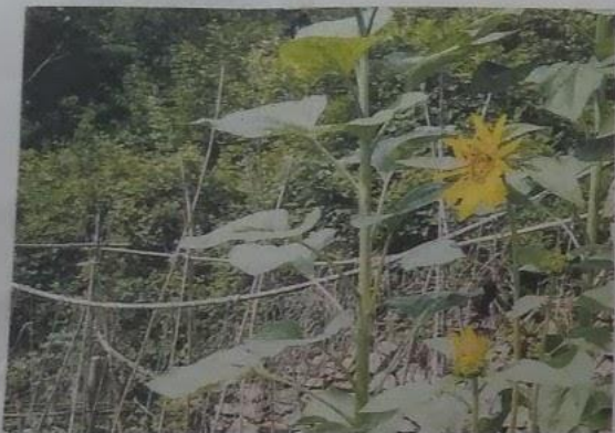
Gli orti biologici al centro del seminario in programma sabato