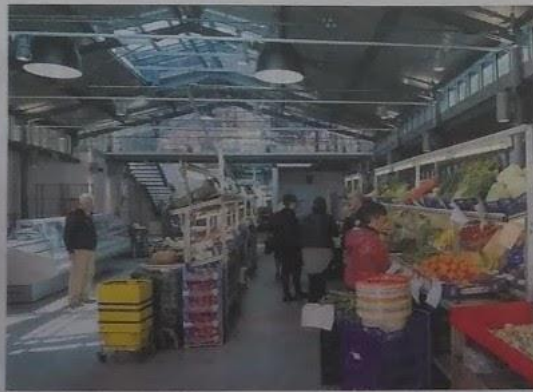
Il nuovo mercato coperto di via Cascione